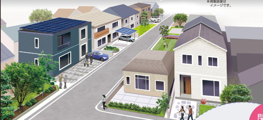
※掲載画像はイメージです。

この期間内に住宅を建築しないことが確定したとき、土地売買契約は白紙となり、受領した金銭は全額無利息にてお返しいたします。