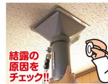
結露の原因となる換気量を調べます。