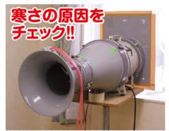
寒さの原因となる住宅の隙間の量を測定します。