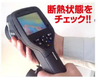
赤外線カメラで壁や天井などの断熱材の状態を調べます。